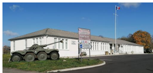
PERMANENCE mercredi 8h30 à 12h00 – 14h00 à 17h00